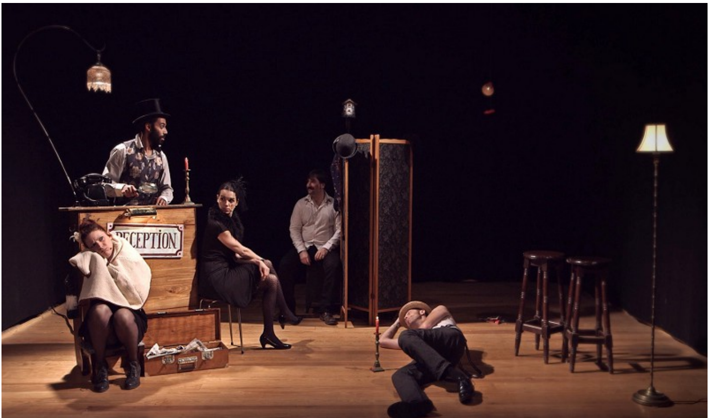
Illustration de l'espace de jeux